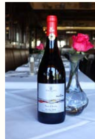
NERO D AVOLLA 29,00€