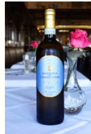
DI GAVI 32,00€