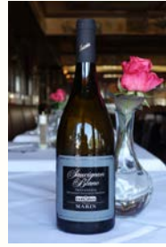
SAUVIGNON BLANC 32,00€